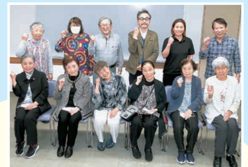
今年もよろしくね!