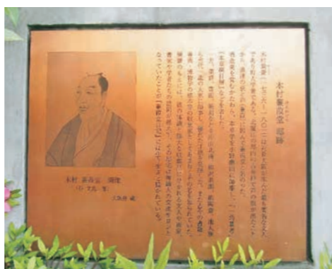
木村兼葎堂の兼葎は「あし」の草のこと。その頃は、商家の間際まで「あし」が覆い茂っていたのだ。

を断ち切ろうとしている為政者をいただいている所に、現在の大阪の大きな病弊があると思います。