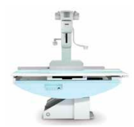
機器画像はイメージです。