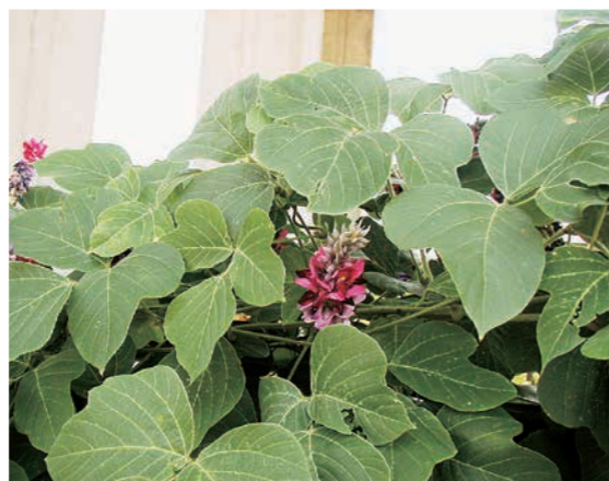
「クズ」[ウィキペディア (Wikipedia): フリー百科事典]より引用 【参考】永井路子「葛の葉抄」PHP文庫

前述の文は、後年にその感慨を述べたものだが、彼女の一生は、自らの感性を大事にしながら、しかも「世間」への批評、忌憚(きたん)のない提言を失わないものであった。こうした「ジェンダー平等」は、男女を問わず「時代を超える」先駆者たるに相応(ふさわ)しいものではなかろうか？