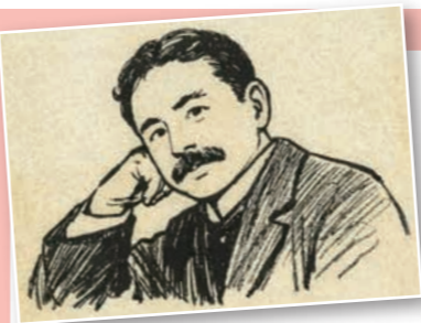
夏目漱石の肖像は、『坊ちゃん』初期挿絵のタッチを参考にしたAI生成画像です。

当時の日記や門下生の手記からは、激しい胃の不調に悩まされながらも、執筆を続けていた様子がうかがえます。