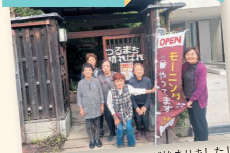
鶴町晴ればれでモーニング始めました!