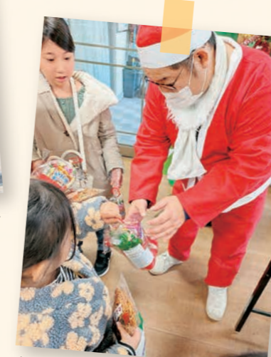
クリスマス会にサンタさんも登場!