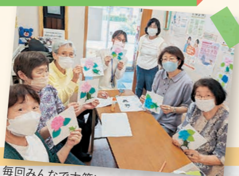
毎回みんなで大笑いです!