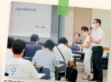
9月9日被爆体験伝承講話