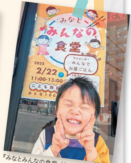
『みなとみんなの食堂』は子ども、大人も、誰でも大歓迎!!