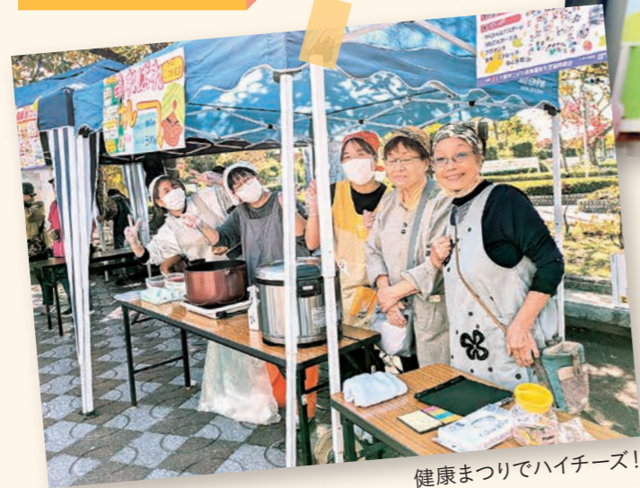
健康まつりでハイチーズ!