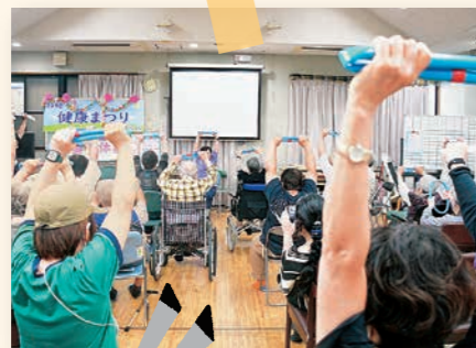
健康まつりは大盛り上がり♪