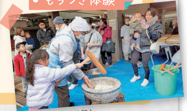
子ども、もちつき体験!

新しい年度が始まり、皆さんいかがお過ごしですか?2024年度、大阪きづがわ医療福祉生活協同組合は新しいイベントの開催や、コロナで中止されていた取り組みの再開など、生協らしい活発な動きとなりました。そして2025年度はいったいどんな年になるのでしょうか?6月22日(日)の総代会(中之島中央公会堂)に向けてみんなで色々な意見を出し合いましょう。またこの『みらい』を使って、「生協こんなことやってるよ」と周りの方にもお声がけいただき、新しく参加される方を迎えましょう!!