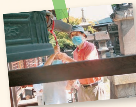
聖天さん平和の鐘つき