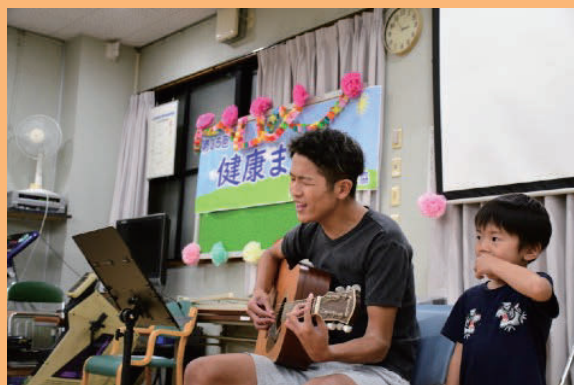
職員の子供によるギター演奏