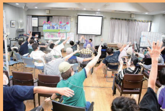
みんな楽しく「フレイル予防音楽ケア体操」