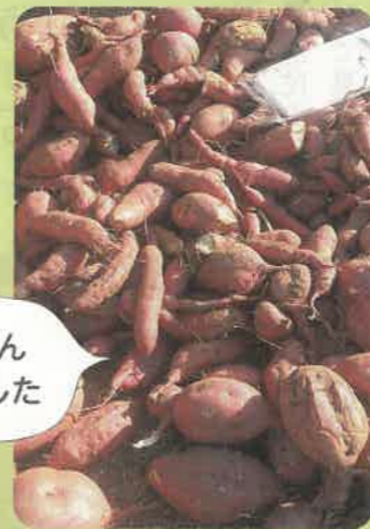
たくさん採れました

ながほり通り診療所でお借りしている畑まで、車で向かいます。子どももみんなウキウキのようで、とても賑やかな車内でした。畑に着いて、みんなでレクチャーを受けて、さあさつまいも掘りの開始！土の中から特大おいもに小さいおいも、どんどん採れます。まるで宝探しのよう