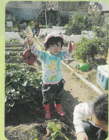
大っきいのも採れたよ！

も必死になって探していました。普段では味わうことができない体験を、子どもも大人も一緒になって気軽にできるように、これからも企画していきたいと思います！