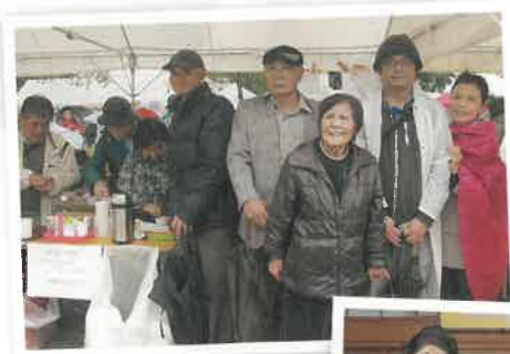
中支部のみなさん

んを増やしながらか、健康づくり活動や平和活動を進めています。そのためにも、組合員さんを増やし、医療生協を地域に大きく広げていく努力が必要です。引き続き、組合員増やしに邁進していきます。