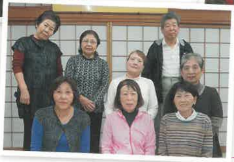
三泉支部のみなさん