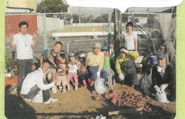
最後にみんなで記念撮影

次回企画のお問い合わせは s.anekawa@minatoseikyo.com まで