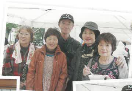
千本北支部のみなさん