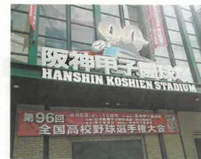
高校野球も大好きです!