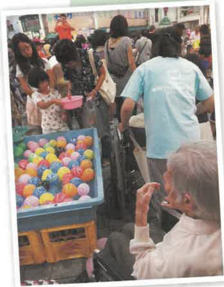
商店街の夜店を散策