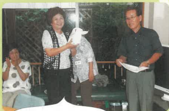
認知症の予防にもなり、賞品ももらって大満足