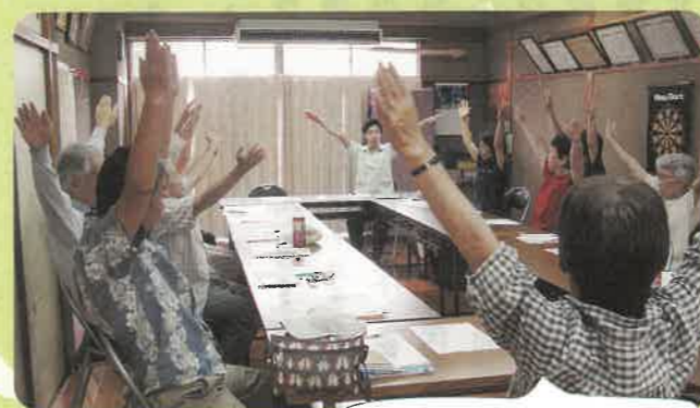
体操で脳イキイキ!

二人一組になって自己紹介をし合った後、みんなの前で相手の方のことを紹介するというゲームもありました。相手の方の事を話すのは情報収集能力・コミュニケーションが必要で脳にいいそうです。頭を使いな