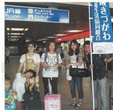
原水爆の見送りー新大阪にて