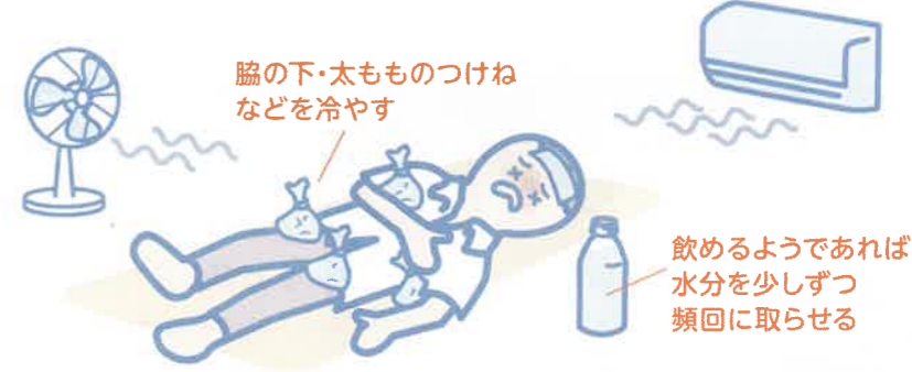
※持病をお持ちの方やお子さんは、かかりつけの医師とあらかじめ相談し、熱中症対策についてアドバイスをもらっておきましょう。