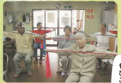
ぜひ参加ください!!

4月に西成エリアでのセラバンド講習会で習ったことを月1回、みんなで集まって楽しく実践しています。高齢者の方でもできるように、「無理しない」を基本にしていますが、つい頑張ってしまう方もおられるため、休憩をしながら行っています。体操の前には、血圧測定もして、健康チェックも兼ねています。