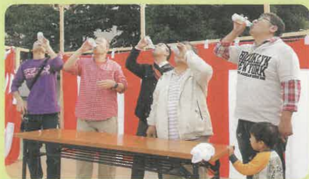
西成の組合員さんもラムネ一気飲みで参加