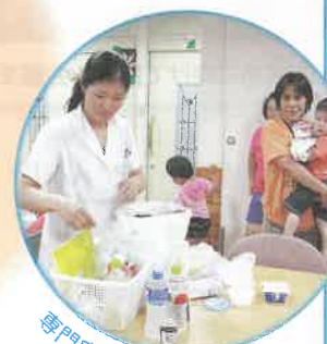
専門家による親子学習会