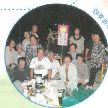
四季折々の班会イベント