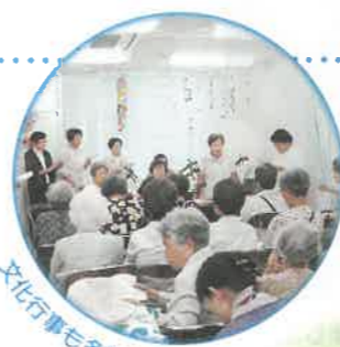
文化行事も多彩に開催