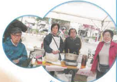
地域の仲間づくり