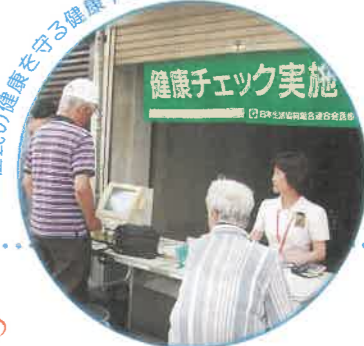
住民の健康を守る健康チェック