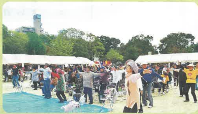
青空の下、みんなで一緒に体操! / 港

10月27日(日)晴れわたる空の下、港区の磯路中央公園と大正区のコミュニティセンター噴水広場で健康まつりを開催しました!西成区では11月10日(日)、雨模様の天気をものともせず、松通公園・梅南集会所ホールにて行いました。