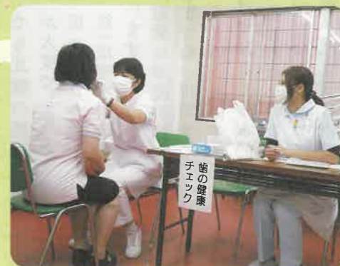
80歳で20本の歯をめざして

望ましいのですが、忙しくてなかなかこれない方や日曜しか時間のない方へ、簡単なチェックだけですが、お口の健康づくりや治療へのきっかけづくりとして、日曜健診等にできる限り参加させていただいております。チェックをさせていただくと、約8割の方が要治療でその大半が歯周疾患にかかっておられますが、定期的に受診しておられる方は約1割という状況です。中にはむし歯を放置したままの方や歯に穴が開いている方もおられます。お口の健康づくりが健康な身体づくりの第一歩です。80歳で20本の歯を残すためにも、歯科健診も受けましょう。