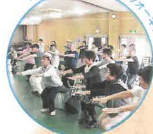
みんなで楽しく健康にウオーキング