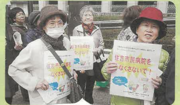
市役所前で請願行動をしました

ます。地域に不足する医療を確保するのは大阪市の責務です。私たちは、①大阪市が誘致している民間病院の公募基準を、住吉市民病院の現地建て替え計画の水準とするよう提案しています。②実現できないなら、公立病院として現地に建てかえるように迫ります。地域医療を充実させるために今までの住民運動を力に、引き続き共に進めていきましょう。