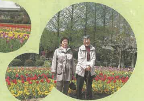
来年もみんなでいっしょに!