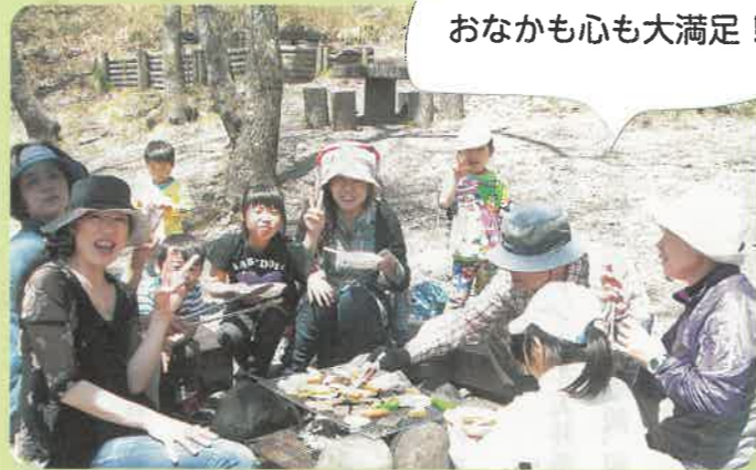
おなかも心も大満足!