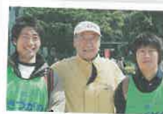
港からも参加しました