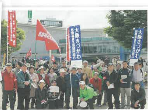
大阪きづがわ医療福祉生協で集合しました