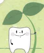
わかば歯科イメージキャラクター