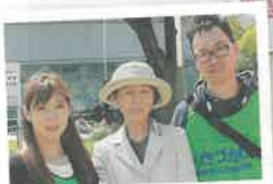
初めての参加でした

大阪メーデーに参加、天満からデモ行進！ 5月1日に大阪きづがわ医療福祉生協からたくさん職員と組合員で参加してきました。今年には好天気に恵まれるも、少し肌寒かったです。初めて参加した職員は、「こんなことやっていたのを今まで全然知らなかった。とても勉強になり、参加できてよかった」と感想もありました。7月には参議院選挙もあります。私たちの暮らしをよくする闘いは、まさにこれからです。