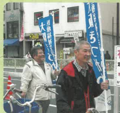
プラカードやのぼりを手に行進

2012年度の社保委員会の活動は、毎回会議の中でミニ情勢学習を行いました。テーマは生活保護問題、震災支援報告会、憲法9条を守る運動、など5回学習会を開催しました。今は、住吉市民病院の現地の建て替え運動に力を注いでいます。