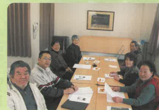
事業所利用委員会のメンバーです