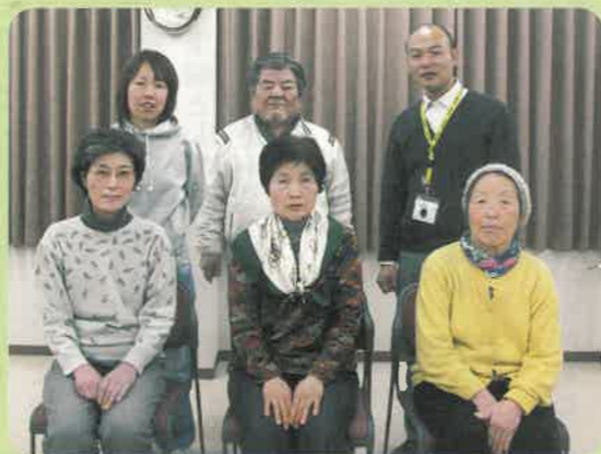
みなさん、ご参加まっています

お誕生月の健康診断のご案内も委員会メンバーで行っています。 これからも楽しい企画を作りますので、ご参加ください。 健康づくり委員会一同