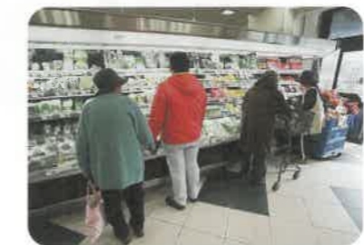
スーパーへ買い物へ

トントン軽やかなまな板の音、利用者さんが昼食の献立で野菜を切る音です。お家では危ないからと家族の心配で包丁は使わないようにしてありますが、ここはスタッフの見守る中、昔主婦として家族のために腕をふるったのが活かされます。