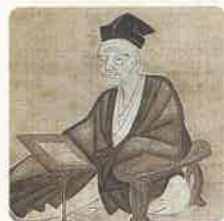
吉田兼好(よしだ けんこう)

「徒然草」の中に一段だけ政治を 厳しく批判したものがあ。その 内容は、後醍醐天皇の「建武の中 興」や「王政復古」の実態が、庶民の