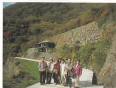
祝島にある棚田で、その石垣の大きさは日本最大級。

島の人口は10年前の1/10で約480名、現在も原発反対運動は月曜日等に続けられています。島での生活が保障されないと原発補助金等に頼ってしまうからだそうです(一部その気配ありとのこと)。 中原 誠