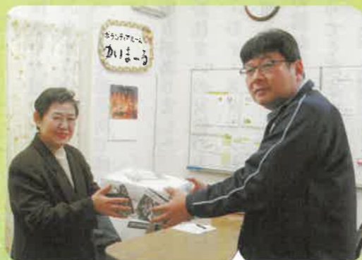
「なかまふやし」目標達成の記念品(西成名物天下茶屋あられ)をいただきました。