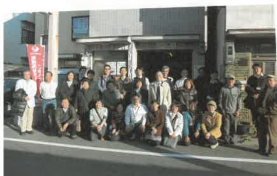
わかば歯科周辺で、みんなで力を合わせてなにかま増やしに取り組みました。