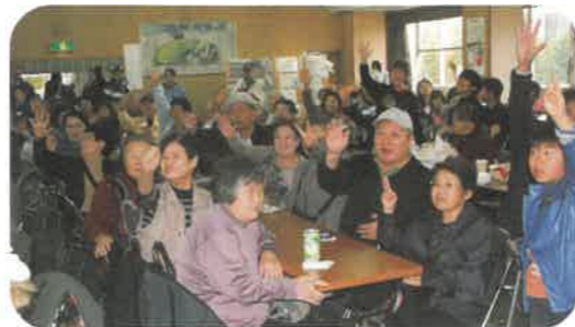
要員のみなさん おつかれさま でした★

11月11日(日)西成エリアの「健康まつり」が行われ、西成区 はもとより、浪速区、阿倍野区、港区などからの参加者も含め て800人の参加者で終日、楽しく交流しました。