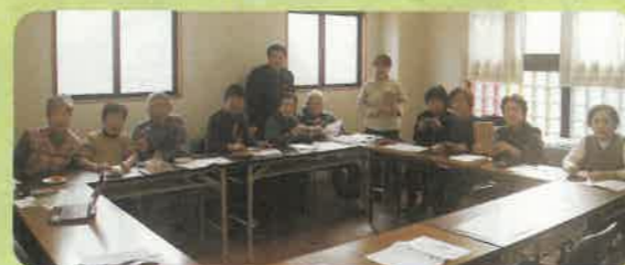
運営委員会であべのポテトをいただきました