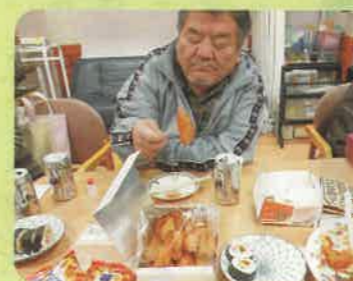
阿倍野名物あべのポテト

達成することができた要因は、地道な地域訪問を毎週行ってきたことと、訪問する前に対象者を決め、準備に時間をかけたことが大きいと思います。月間に入る前に運営委員さんと仲間増やしをどうしていくか