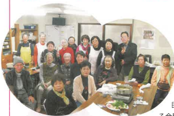
「新春餅つき大会」を やろうと 相談しています♥

でない人はいないか」と呼びかけています。 12月に入っても、定例の班会の案内と同時に 新規組合員の拡大を忘れずに訴えるようにな りました。また、旧医療生協時代の1000円 会員さんを訪問し、デイサービスの開設を訴 え、前回22日の世話人会以降、24名の新規会 員が増え、年間累計で125名になりました。 12月20日(木)には、恒例の、「浪速支部・ 望年会」を開きますが、新しい組合員の方 にも連絡し、「あったか浪速支部」をいっしょ につくってこうと呼びかける予定にしてい ます。