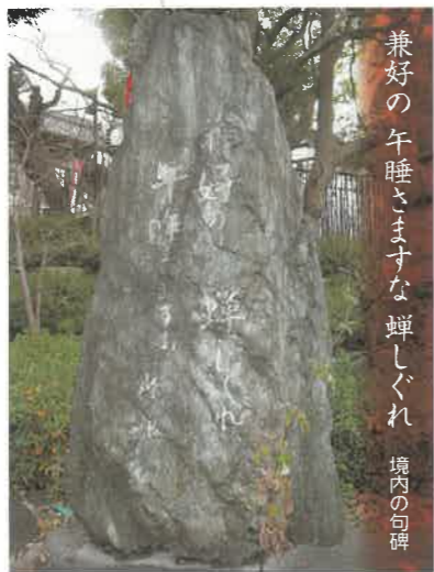
兼好の午睡しますすな 蟬しぐれ 境内の句碑

通説では南北朝の争いで、当時 伊賀でくらししていた兼好が南朝の 密勅を受けて、奥州の北畠顕家の もとに赴いた。その後、顕家が高師