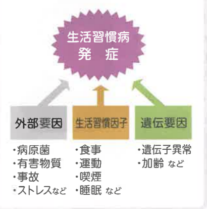
生活習慣病を引き起こすメカニズム

厚生労働省の調査では、肥満者BMI 25以上で高血圧や脂質異常症になる確率が2倍、BMI 27以上で糖尿病になる確率が2倍になるとされています。その他生活習慣病の多くは肥満が原因とされています。肥満は食べすぎや運動不足、深夜までの仕事などによる夜の遅い食事など生活習慣が乱れると起こってきます。大きな病気を引き起こさないためにも、毎日の食事、生活スタイルを見直す必要があります。