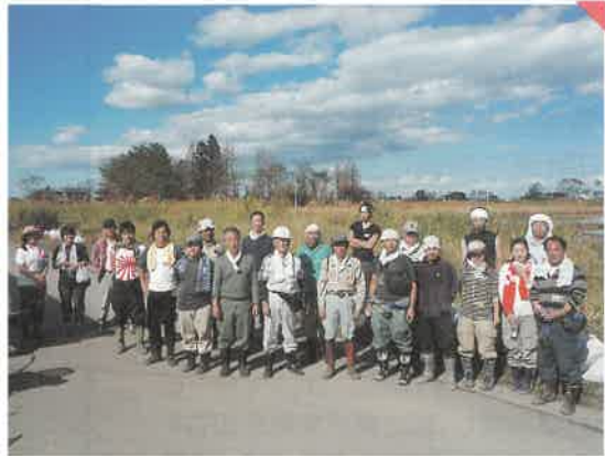
宮城県山元町震災支援