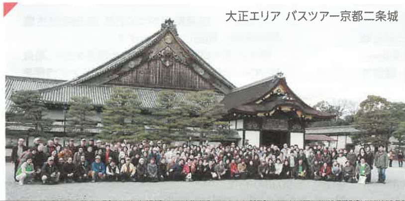
大正エリア バスツアー京都二条城

「税と社会保障の一体改革」(国政)と大阪市長(地方自治)の動きを一体的に捉え、新しい福祉国家の展望とそのなかで地域を舞台に、安心して、住民が主人公として住み続けられる街づくりをすすめていくことが当面の課題です。社会保障では、こどもたちから働きざかり、高齢者、女性など総合的に捉えて、憲法25条の「すべて国民は健康で文化的な最低限度の生活を営む権利を有する」という条文を目標に運動に取り組みます。