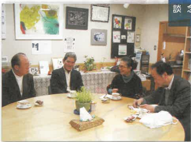
大阪きつがわ医療福祉生協