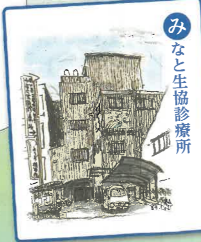
みなと生協診療所