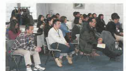
参加された職員のみならず

3生協合併が決まってから、機関紙担当者は正月明けから、頻りに集まるようになりました。各医師協から2、3人、そして関西共同印刷から2人が来られて4月の創刊号にむけて、表紙から、8面の裏表紙に至るまでカンカンガクガク協議を重ねました。頼まれた記事を書くだけの私が、こんな場に参加して良いのだろうかと思いつつ、ずるずると引っ張ってこられました。初めての対談形式のインタビュー3生協のトップのお話、半分上の空でした。まとめるのが大変でしたが如何でしょうか? 皆様のお便り楽しみにしております。