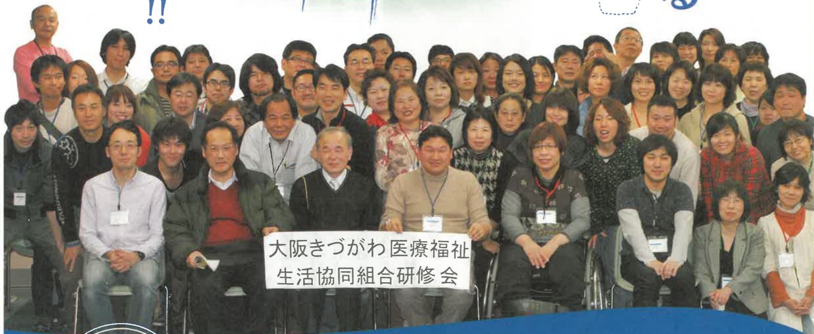
大阪きづがわ医療福祉生活協同組合研修会

大阪きづがわ医療生協第一回通常総代会 6月24日(日) 午後2時 西区こども文化センター