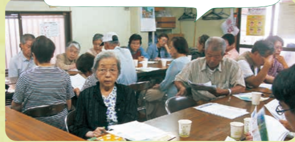
楽しく学ぶ参加者のみなさん

ることが大事だと認知症の症状や介護者の心得についてユーモアを交え、わかりやすく話しました。また、認知症に伴う行方不明者が3年連続で1万人を超えていることを示し、認知症の方を町でみかけたら声をかけて、徘徊行方不明者がでないようにと協力を呼びかけました。