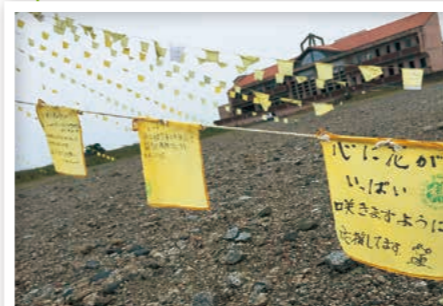
被災地にはためく応援のメッセージ