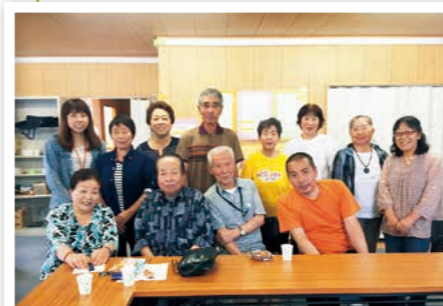
仮設住宅集会所での交流会にて