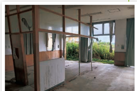
津波の被害にあった特養

被災のひどかった ゆりあげ 閑上地区の閑上中学校では慰霊碑と学校の机があり、机にこの学校で亡くなった14名の生徒へのメッセージが書かれており、胸が熱くなりました。被災された方々との交流での健康チェックでは皆さん、とても、明るく笑顔が素敵で、体操もバリバリされており、脳トレクイズをだすと、積極的に答えられ、もり上がりました。今回の支援は非常に貴重な体験ができ、感動もあり、よかったです。会った人たちも本当に生きるパワーに満ち溢れており、たくましく思いました。