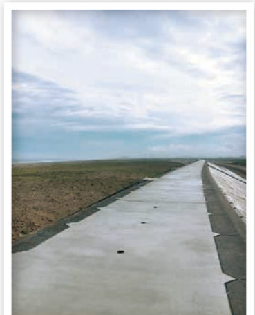
閑上の海岸から福島に伸びる防波堤

東日本大震災から5年経ち、現地には新しい家や駅が建っていました。しかし集中的に復興が進められている以外の場所では家の土地枠だけ残され雑草が茂っている土地や海岸の方まで続く荒地があり場所による復興の差を感じました。現地の方々はボランティアが来てくれることで地元の皆が集まるきっかけになり同窓会のように楽しいと笑顔で迎えてくださり皆さんと楽しい時間を過ごすことができました。皆さん、次は秋祭りでのラーメンを楽しみにしておられました。