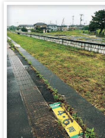
旧山下駅のホーム跡