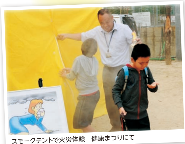
スモークテントで火災体験 健康まつりにて