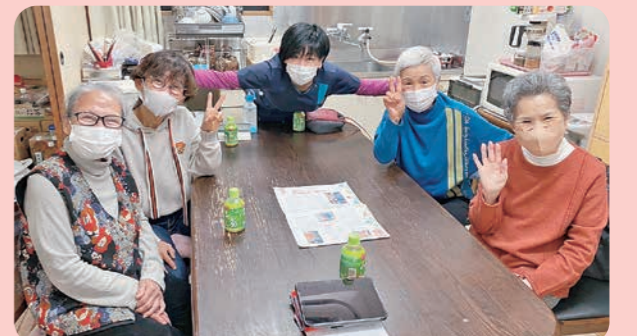
家族を自宅で看取られた方や、現在介護をしている家族の方などが集まって色々な話をするのが「在宅家族の会」です

この家で この地域で 生活つづける くらし ま くきづがわ『であい・ふれあい・支えあい』けあ