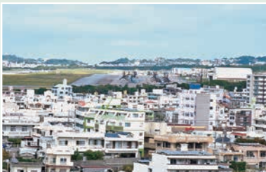
普天間飛行場 周りを住宅が囲んでいます

いるといえます。高台周辺には戦争中の遺構（トーチカ、砲弾の痕跡の残る壁など）もあり、激戦地であったこの地での悲惨な歴史にも触れました。その後は那覇空港に向かいながら、バスの中から那覇軍港の移設予定場所（豊かな自然が残るとも綺麗な場所です）や現在の那覇軍港を視察しました。地元の方の解説を聞きながら改めて辺野古だけでなく沖縄は様々な問題にさらされていることが理解できました。自分には何が出来るのかと考える機会となりました。