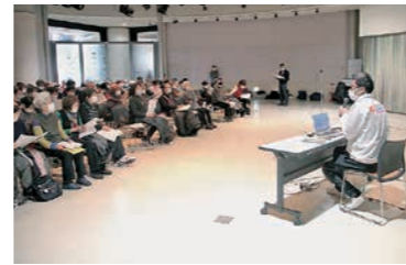
秋の健康チャレンジゴール集会で、まとめの話