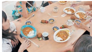
みんなでワイワイと昼食会。子どもも大人も参加していました