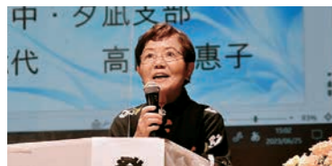
「住み慣れた地域で老いる」に必要なのは、①身体面、②精神面、③社会について気軽に話し合える場だと思い、みんなで「ひだまりの会」をはじめた