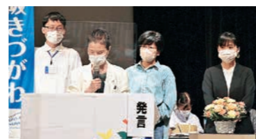
6月総代会で、世界大会への参加バトンを前年参加者から引き継ぎました