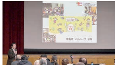
新春学習互礼会で子ども食堂をテーマに学習。パルコープさんのフードバンクの取り組みをお聞きしました