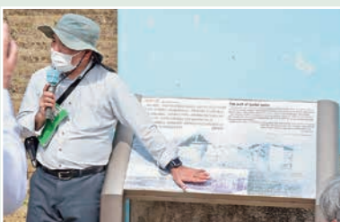
地元ガイドの方による解説