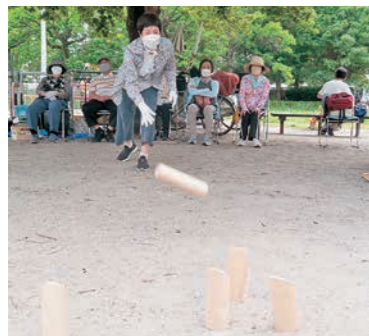
コロナ禍を乗り越えみんなで集まろうと始まった「モルック班会」