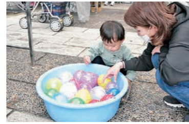
4年ぶりに開催できた健康まつり、集まった笑顔がステキです