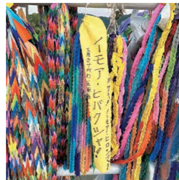
原水爆禁止世界大会in長崎