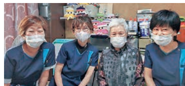
最期まで家で過ごしたいとの夫の願いを妻とスタッフで支え続けました