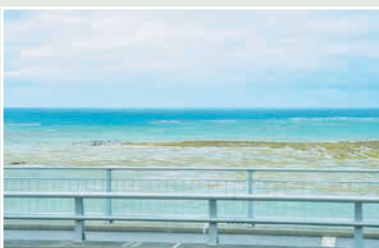
那覇軍港移設予定地（綺麗な海でした）