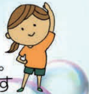
スクエアステップ班会