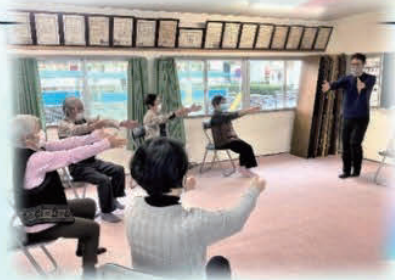
波除・市元体操班会