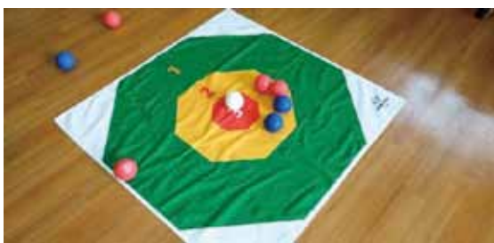
白いボールが的になり互いのボールを近づけて点数を競っていくゲームです