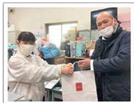
介護よろず相談所