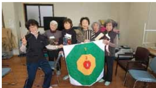
ポッチャ後、景品のサプライズがありました

毎月第2木曜日に班会を行っています。先月は班会参加者の皆さんで楽しんで過ごそうとポッチャを体験しました。ポッチャの説明を受け投げる練習をしましたが、皆さんとても上手！早速ペア戦を行いゲームに入りましたが、いざ始まると練習のときと違って自動的にボールを近づけることがなかなかできませんでした。でも慣れてくるといよいよ白い球(的)に寄せるナイスショットが何回も出ました。接戦ですごく盛り上がりました！参加者の方も楽しんでくれた様子で次回もポッチャができればと思います。普段は体操しています。