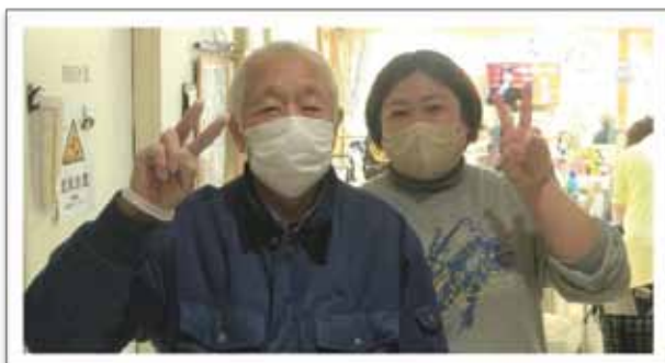
小規模多機能介護しおさいの家