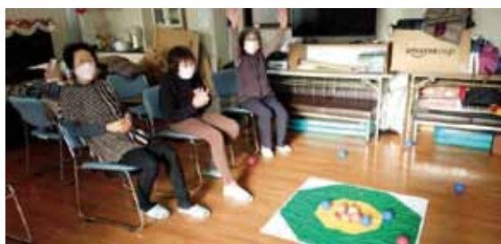
決着がつく瞬間の様子

毎月第2木曜日に班会を行っています。先月は班会参加者の皆さんで楽しんで過ごそうとポッチャを体験しました。ポッチャの説明を受け投げる練習をしましたが、皆さんとても上手！早速ペア戦を行いゲームに入りましたが、いざ始まると練習のときと違って自動的にボールを近づけることがなかなかできませんでした。でも慣れてくるといよいよ白い球(的)に寄せるナイスショットが何回も出ました。接戦ですごく盛り上がりました！参加者の方も楽しんでくれた様子で次回もポッチャができればと思います。普段は体操しています。