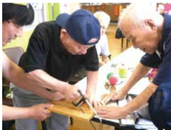
写真③ スタッフと一緒に工作