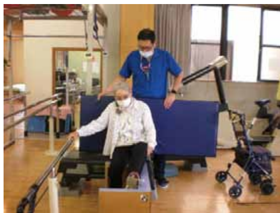
写真① 自宅入浴時の動作練習

自立を目指したリハビリテーション（写真①）や、スタッフと一緒に調理を行ったり、木材から棚などを作る作業療法（写真②、③）を行うことで、認知症のリハビリも行っていきます。