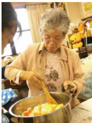
写真② スタッフと一緒に調理