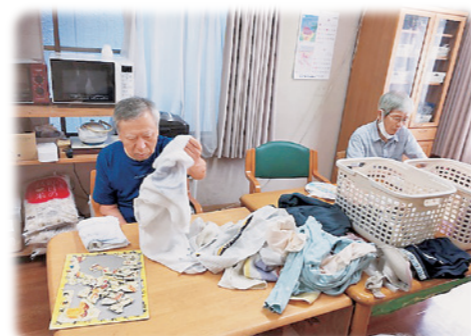
洗濯物もみんなで畳みます

グループホームは家庭的で落ち着いた雰囲気の中で食事の支度や掃除、洗濯などの日常生活を入居者さんと職員が一緒に行う事により認知症状が穏やかになり安定した生活とできるだけ本人の望む生活を実現することを目的にまた、地域の中で入居者さんも地域住民として生活できるように支援します。