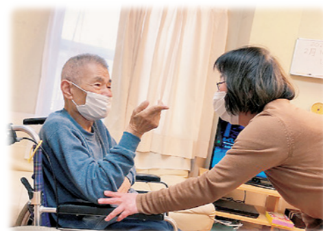
お知り合いの方と面会もOK