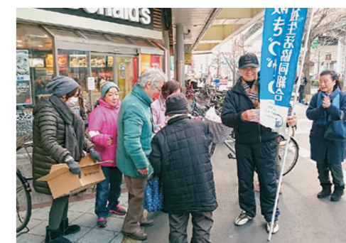
各エリアで宣伝活動をおこなっています