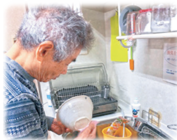
家事はみんなで分担します