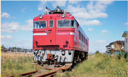
JR常磐線車両と流出した線路