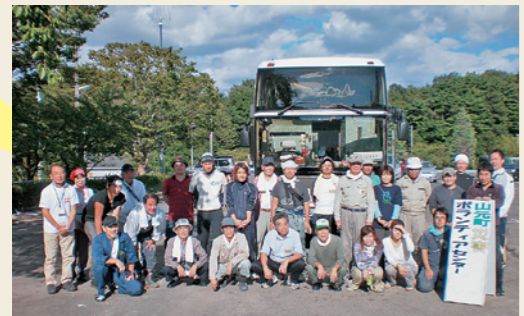
2011.9 きづがわボランティアバス