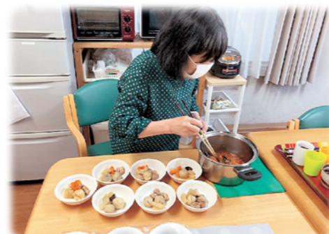
食事の配膳、真剣です