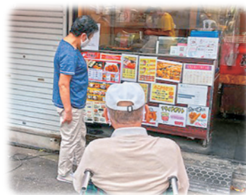
外出も可能です。毎朝の散歩も行っています