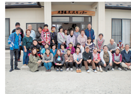
現地みやぎ県南医療生協主催の花釜山元まつり（作成したDVDでも紹介）

生活再建に向けインフラ整備が進み、海岸沿いには防波堤が建設、今年3月に完成した津波に対しての防衛・減災機能として旧路線を盛り土し県道が走っています。新山下駅、新坂元駅周辺に復興公営住宅（以下復興住宅）が建設、周辺には防災拠点・交流機能を持つセンターも建設されました。 現在仮設住宅はなくなっているとのこと。被災者の全てが復興住宅に移られたわけではなく、家族がいる仙台市や県外へ移り山元町では人口減少が進んでいます。復興住宅に関しては今年に入り、山元町では世帯収入に応じて家賃の値上がりの話も浮上しているとのことでした。 みやぎ県南医療生協の組合員活動ではコロナ禍で情勢を見ながら、月1回の山下地域・牛橋地域での健康サロンは継続、自粛していた班も今年の秋に再開する動きもあるそうです。現地の組合員さんが元気で過ごされている様子がお話から伺えました。