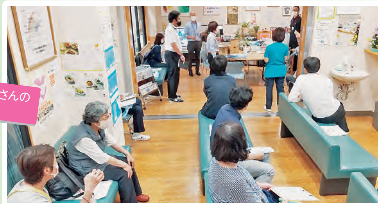
行動に集まったたくさんの組合員さんと職員