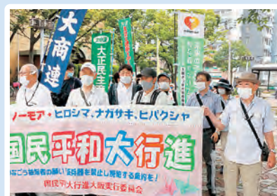
大正区役所前、出発