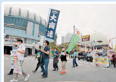
大阪ドームを行進

日本にとって核兵器廃絶は究極の願いですが、政府は後ろ向きの姿勢を取り続けています。