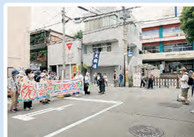
此花区役所前出迎え、出発式