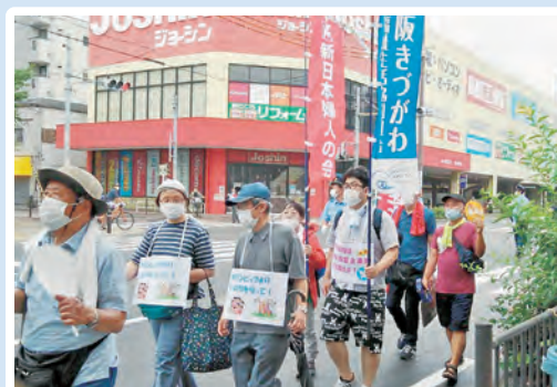
首かけメッセージボードを準備して参加

当日は雨模様、感染対策でマスクをしながらシユプレヒコールなしの行進でしたが、原水禁世界大会で現地にいけない分の平和の思いを込めて、阿倍野までの行進に参加しました。