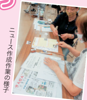
ニュース作成作業の様子