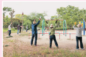
地区の仲間とラジオ体操