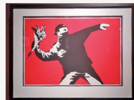
パレスチナでのバンクシーの壁画