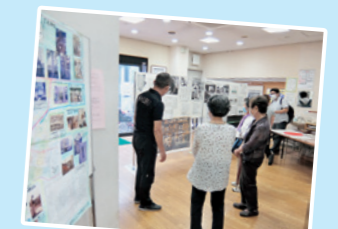
みなと生協診療所で 戦争展