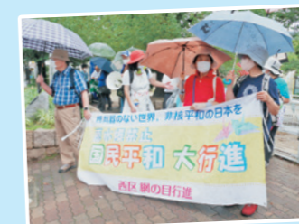
平和行進を 歩きました