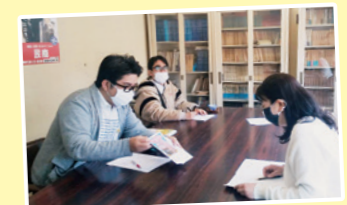
生活困窮の実情把握に向けて 民商さんと懇談