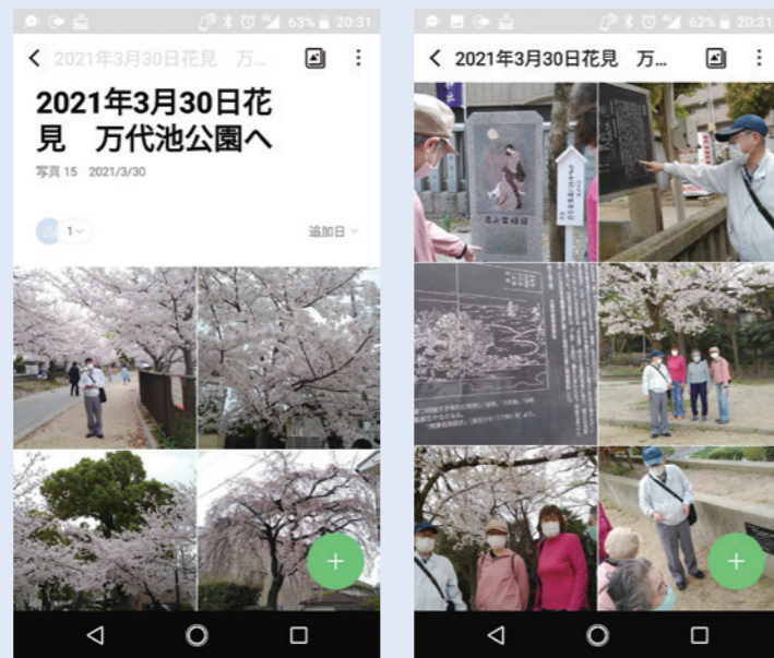
※「LINEアルバム」の作り方は「みらい Vol.106」(1月号)で紹介しています。ご参考ください。