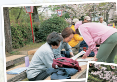
健康チャレンジのお話し