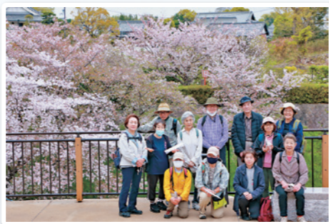
城跡全員集合(写真撮影の為マスクをはずしています)

大正エリアでは健康づくりの一環として健康づくり委員会主催の健康ウォーキングに取り組みんでいます。企画の歴史は古く、今回で122回目を迎えます。新型コロナウイルス感染症拡大以降は中止を余儀なくされることがあり久々の開催となりました。