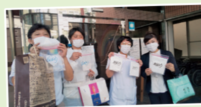
西成民主診療所のスタッフ