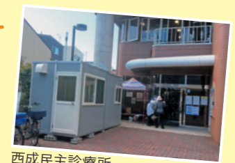
西成民主診療所 門前の仮設診察室