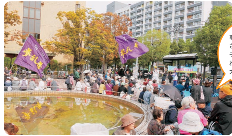
小滝委員長の挨拶

お子様向けのゲームコーナーを、平尾、ほくと、南恩加島支部で開き、行列が出来るまではいきませんでした。何回も挑戦される子どもさんもありました。