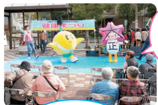
今年も福島県からゆるキャラのキビタンが、大正区からはツージが来演。息の合ったキビタン体操を披露してくれました。