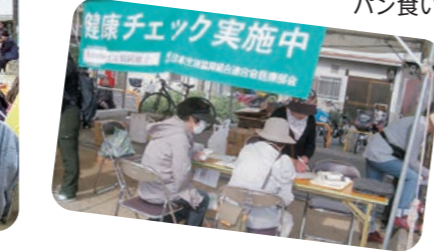
健康チェック実施中