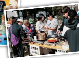
健康まつりに協賛いただいた団体 青空学童、小澤歯科、劇団潮流、こつま薬局、さくら保育園、新婦人西成支部、誠電社、どんぐり保育園、西成民主商工会、西成子どもと教育を守る会、西成高校軽音楽部、年金者組合西成支部、浪速民商、浪速生活と健康を守る会、きづがわ共同法律事務所