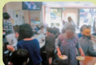
※プライバシー保護のため画像加工しています。