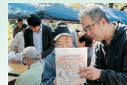
▲骨量・足指力の測定結果を丁寧に説明

噴水前舞台ではフラダンス(新婦人)、エイサー(大正高校)、和太鼓(円陣)、ダブルダッチ(Dachico282)、よさこいソーラン(夢乱舞)が出演し観衆を魅了。