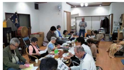
潮路支部 (5月14日開催)