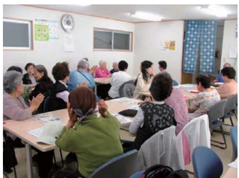
千本北支部 (5月12日開催)