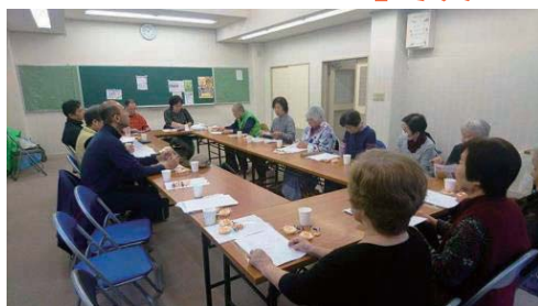
南津守支部 (4月15日開催)