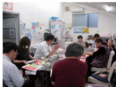
天下茶屋東支部 (5月2日開催)