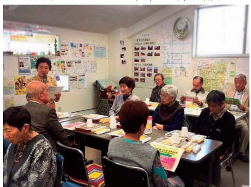
天茶・聖天下支部 (4月28日開催)