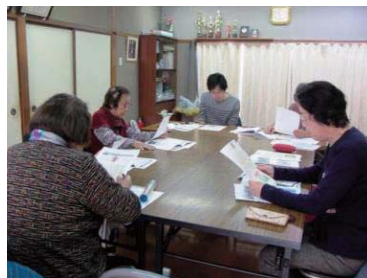
千本中南支部 (4月20日開催)