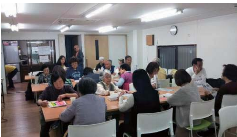
浪速支部 (5月13日開催)