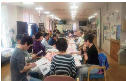
西北支部 (4月29日開催)