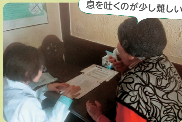
息を吐くのが少し難しい!

クです。また、呼吸器疾患の多い港区では、若い人も1度はやっていただきたいチェックです!やってみたいという方は、ぜひみなと生協診療所までお問い合わせください!06-6571-0606