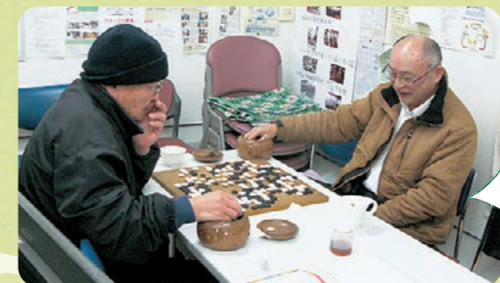
囲碁の名人がいます!