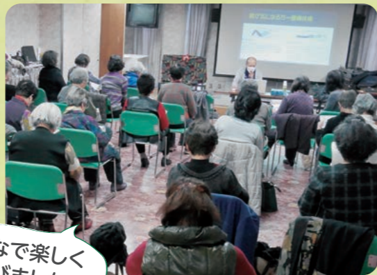
みなで楽しく学びました!

び、体を回したり足を広げたりなど、大きな動きで筋肉や関節を動かし、体をほぐすと急に盛り上がり、和気あいあいと、これは大丈夫や、これは無理や、など楽しんで参加されていました。資料も大きな字で、体操やストレッチも絵入りで分かりやすく解説され、これを見ると家でもできるので、毎日続けられそうです。ゆっくり呼吸をしながら、気持ち良いと感じる程度に、反動や押さえつけたりはしないように、筋肉が伸びていることを意識して、20～30秒ゆっくり伸ばすことがポイントだそうです。皆さんも、ロコモ予防今からでも間に合いますよ!毎日続けることが肝心ですね!