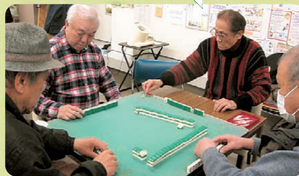
みんなで楽しく健康麻雀♪