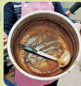
みんなおかわりしてくれました!

2月9日(金)午後6時～8時、こつまの里で西成キッズダイニング(子ども食堂)を開催。大人20名、子ども13名の参加でした。この日のメニューはシチューとパン。40人分用意したシチューは完売しました。小学4年生の男の子は、4杯もおかわりをしてくれました。一生懸命作った組合員さんは、とても喜んでくれていました。次回は第10回になります。