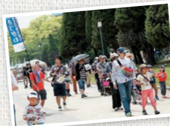
今年もみんなで楽しく歩きましょう！