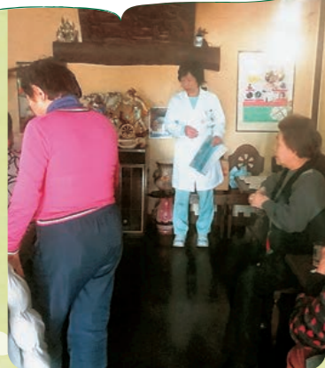
肺機能についての説明を薬剤師さんにしてもらいました!

皆さん自分の結果に一喜一憂!心配されている方には「気になれば精密検査をかりつけのお医者さんに相談してください」と声かけをしました。